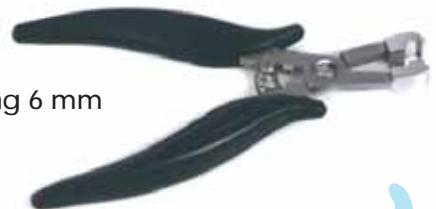
Platdruktang 6 mm