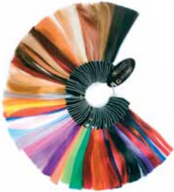
Kleurenring Synthetisch haar