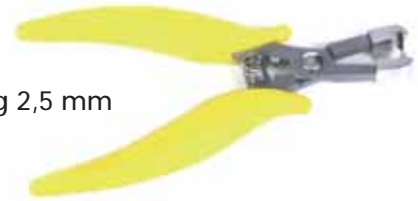
Platdruktang 2,5 mm