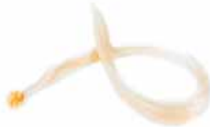
Locks Natural Hair