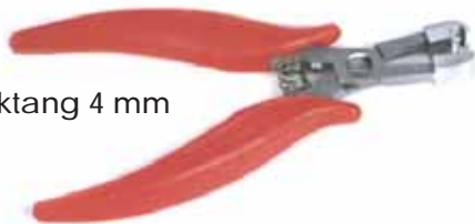
Platdruktang 4 mm